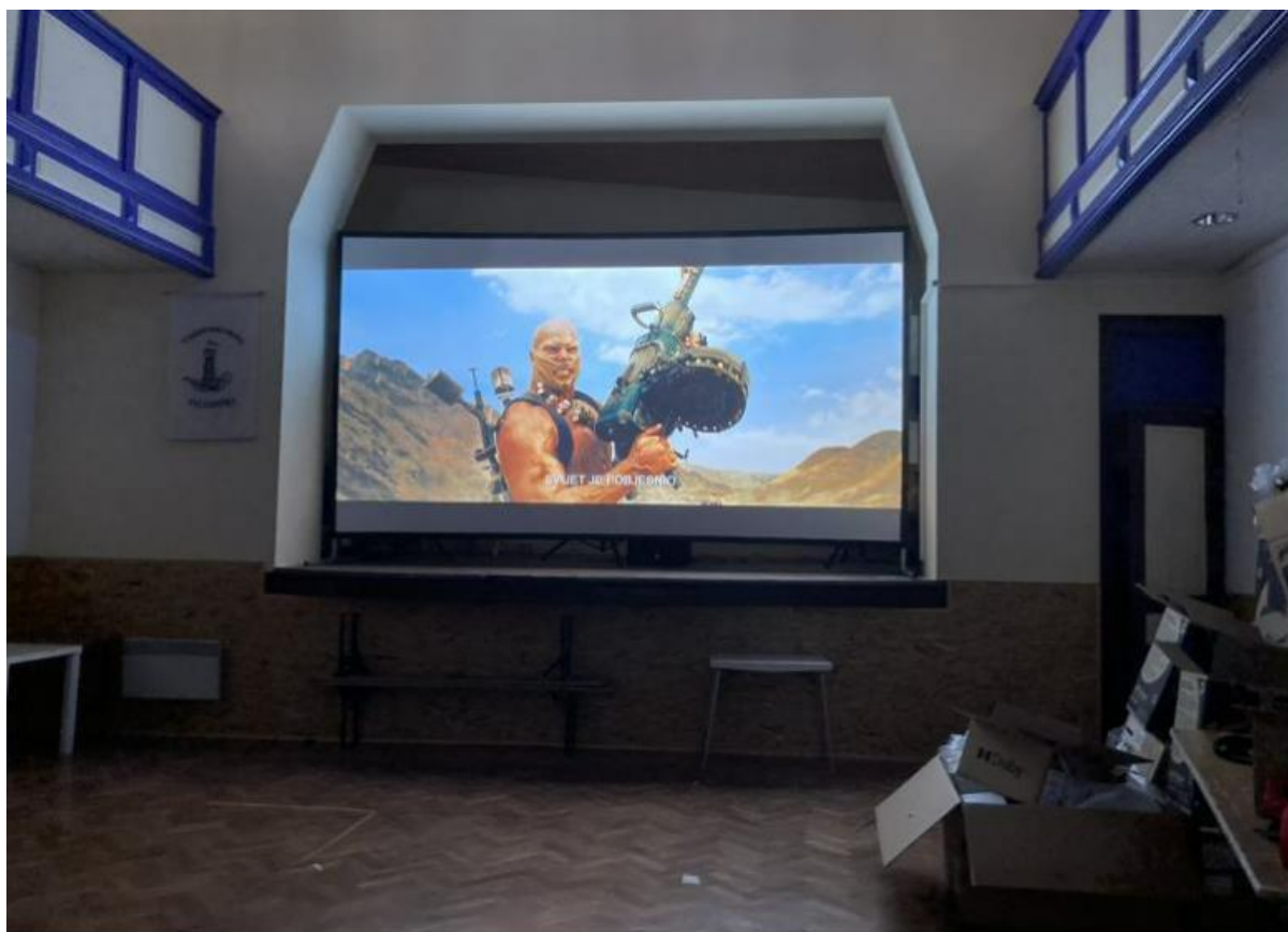
Slika 2 Nova digitalna oprema u kino dvorani pruža pravi kino užitak, ali je potrebno i dodatno ulaganje u izolaciju i preuređenje balkanskog dijela dvorane

Također u sklopu naše organizacije već 3 godinu zaredom organiziramo APOX film festival koji okuplja nezavisnu filmsku produkciju dokumentarnog filma i za koji imamo odlično isplanirani programski sadržaj za 2022 godinu u trajanju od 5 dana, 5 dana i ograničenih 30 vrhunskih dokumentarnih filmova koji ne samo da spajaju direktore i distribucijske kuće, već privlače i inozemne goste, privlače domaću publiku te regiju. Kako bi priuštili svakom pojedincu da osim filmova ima i zabavu, osigurali smo muzičke večeri, radionice za crowdfunding od strane Zorana Rajna, otvorenu diskusiju vezano za mirovne pregovore koje će voditi Goran Božičević te filmsku radionicu organiziranu od strane Filmaktiva Rijeka.