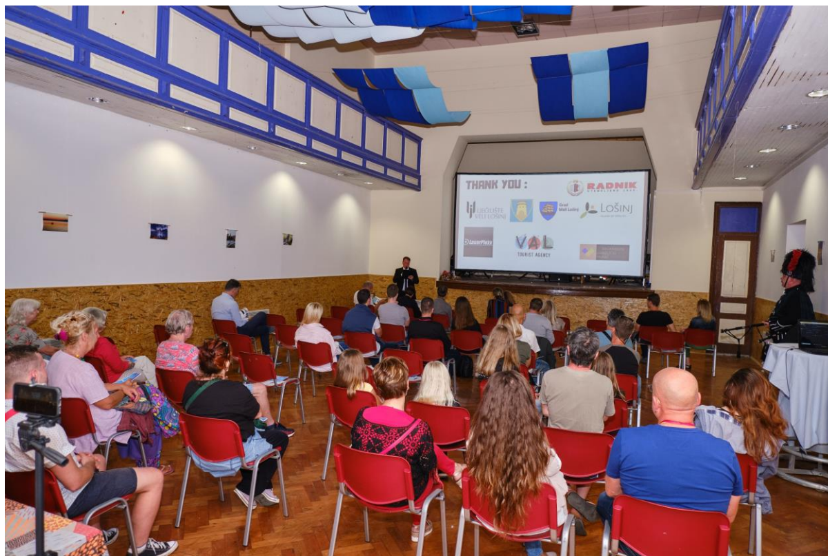
Slika 1 Velika posjećenost otvorenja APOX 2021

Uživanje u filmu mora imati svoje čari, okolinu i zanimanje publike. Nigdje nije tako ugodno za čuti zvuk i uživati kroz cijeli doživljaj filma uz kokice u jednoj ruci i picu u drugom. Nase novoosnovano kino Veli Losinj pruža većinu ugođaja pravog kina, projektor, platno, zvučnici , kompletna oprema za pravi kino doživljaj. Od otvorenja u 6 mjesecu 2021 imali smo preko 800 gledatelja do danas, s vrhunskim nezavisnim kino programom i najnovijim naslovima postavili smo se kao jedno od najboljih kina na otoku, te iz dana u dan pojačavamo utjecaj na kino karti . Naše kino privlači strance i domaće, te je u doba korona krize s popunjenosti koju možemo imati(40 osoba) u 80 posto slučajeva se sve popuni. Nadamo se nastavku kvalitetne izvedbe programa i tokom zimske sezone, a za to nam je potrebna pomoć VAS jer nam je u planu završiti adaptaciju prostora da bude na razini pravog art kina, s ugodnim stolicama, uredbenim balkonskim dijelom , te postavljenom zvučnom izolacijom kao i osiguranje kvalitetne filmske ponude za svačiji ukus.