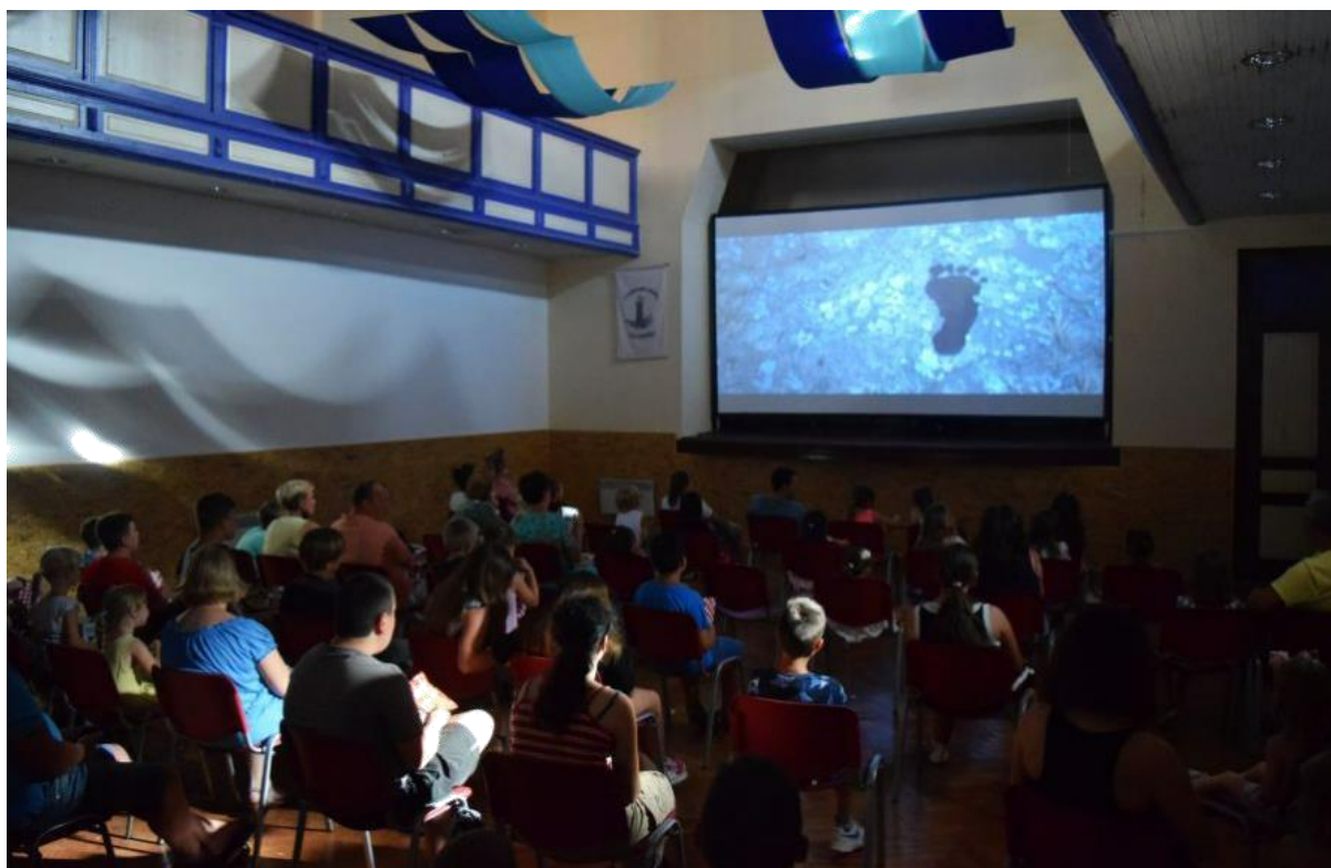
Slika 4 Vrhunska posjećenost tokom cijelog ljeta